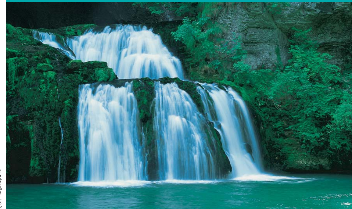
AGI0206 - Ed. NOV.05 - Crédits photos : Getty Images, DR - tagora-paris